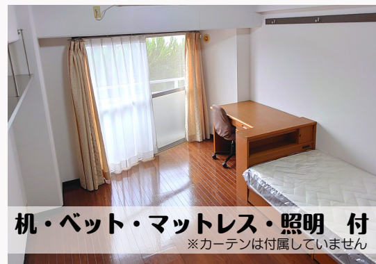
机・ベッド・マットレス・照明 付 ※カーテンは付属していません