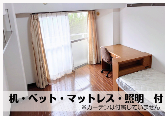
机・ベッド・マットレス・照明 付 ※カーテンは付属していません