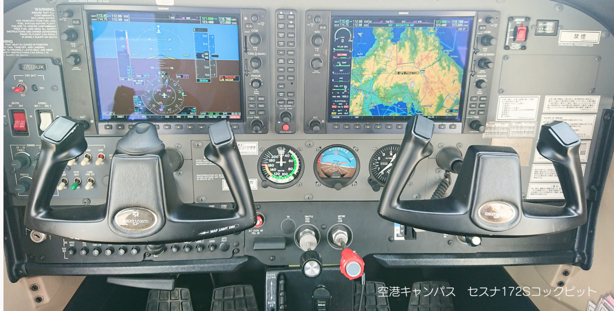
空港キャンパス セスナ172Sコックピット