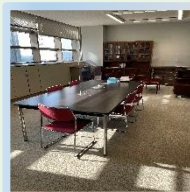
▲学生支援センター