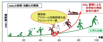
図1 AGEsの生成と疾病・加齢との関係