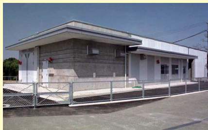
衝撃先端技術研究センターの外観

そのエネルギーは、およそ20万気圧の超高圧を生み出すため、通常的环境下では得難いものが瞬時に作製できます。主に金属材料に適していますが、貴社のアイデア次第では、他の素材でも他者(他社)にはないものが作れると思われれます。