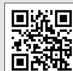
入試サイト ページ

入試情報の他にも、資料請求 やイベント情報など受験生・ 高校生向けの情報を提供して います。