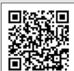
入試課公式LINE アカウント