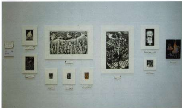
アート・イラストレーション・学部 / 長崎県生まれ