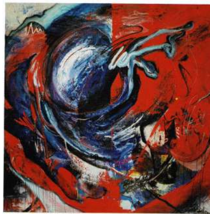
洋画・学部 / 熊本県生まれ