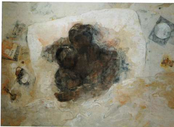
日本画・修士 / 熊本県生まれ

崇城大学第23回芸術学部卒業展・第21回大学院芸術研究科修了展 [SOJO UNIVERSITY STUDENT EXHIBITION 2026] 会期 ● 2月17日～2月23日 会場 ● 熊本県立美術館 分館