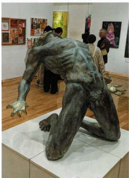
3Dアート・学部 / 福岡県生まれ