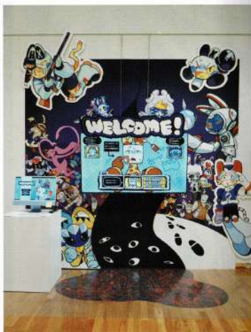
アート・イラストレーション・学部 / 熊本県生まれ SDx 兼 Unity / CLIP STUDIO PAINT Procreate ©2025 KOHJIMA

キャラクターデザインにセンスの高さを感じた。正面モニターの映像は手書き感のあるオリジナルキャラクターに実写の映像などを織り交ぜた構成で見応えがあった。