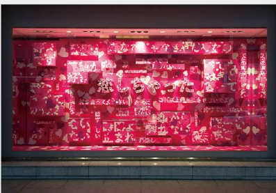
鶴屋百貨店 ディスプレイウィンドウデザイン 「こっち向いて」CS デザイン優秀賞受賞