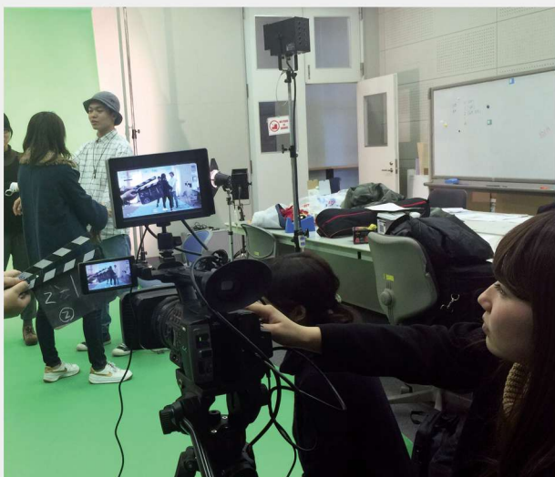
グリーンバック撮影

現在、世の中がどういう立場でどういう動きをしているのかを常に意識し、時代に仕掛けるプロジェクトを心がけています。学生一人一人の個性を大事に、プロジェクトを進行することで、実戦で経験する責任感と出来上がった後の達成感を得ることができます。また、そういった活動を通してデザインの技術だけでなく、コミュニケーション能力や意識的な部分の成長も期待できます。体験現場に入って見えてくるものがほとんどです。