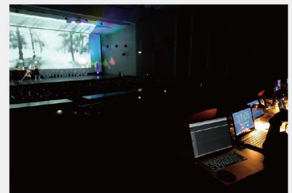
TED×KUMAMOTO 舞台芸術映像制作オペレーション