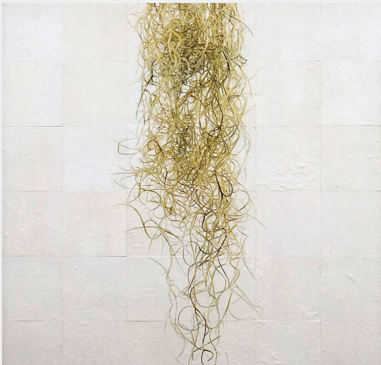
第66回モダンアート展 「Spanish moss」入選（東京都美術館）

個人の活動では、毎年モダンアート協会の公募展の写真部門に応募し、一般的な写真とはまた違った写真表現の実験的な発表をおこなっています。高文連の写真部の審査員と作品講評会を務めています。また、夏開催の撮影研修会の講師も担当し、指導にあたっています。現在写真がもつリアリティーを追求するために写真のマテリアルにこだわったテクスチャー表現の作品を制作発表中。