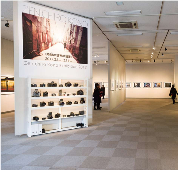
Zenichiro Kono Exhibition 2017