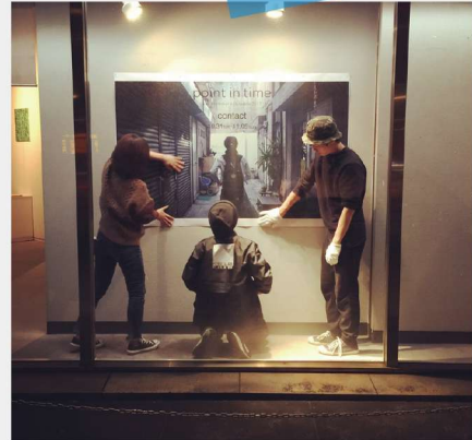
Point in time 2017 展示作業