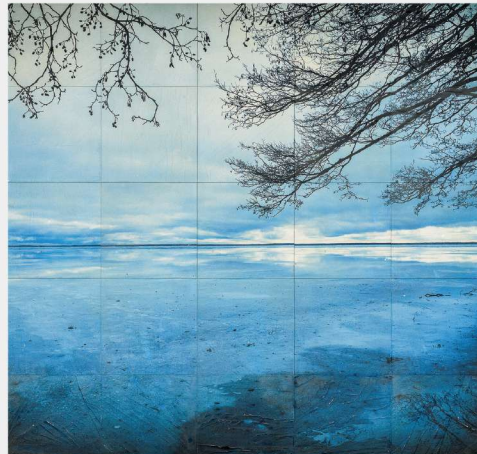
第68回モダンアート展 「時間の世界の情景 2018」入選（東京都美術館）