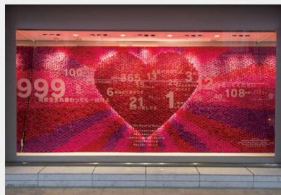
鶴屋百貨店 ディスプレイウィンドウデザイン 「The Heart of Roses」