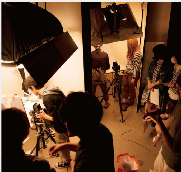
スタジオ商品撮影実習