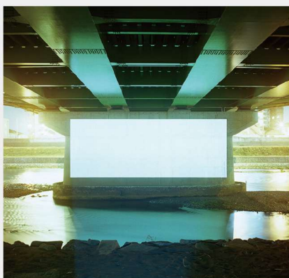
ユーナ 21 10周年記念展 クロッシング・カオス 「Projections in the city」(銀座二コソサロン)