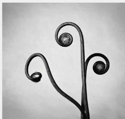
第60回モダンアート展 「image-007」入選（福岡市美術館）