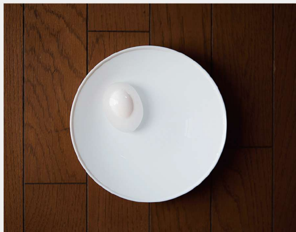
2018年 第46回 公益社団法人日本広告写真家協会公募展 入選「惑星」/ 福山大夢