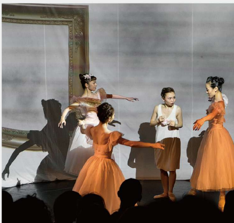
プロジェクションマッピングによる舞台芸術 「FRAME」SECONDSIGHT 5F