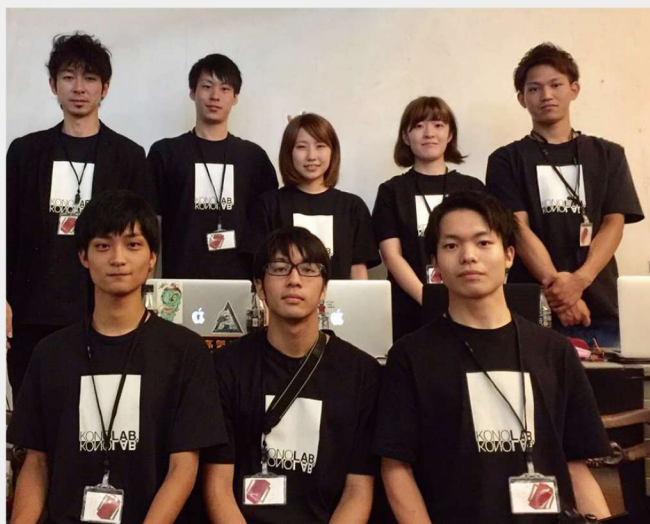
プロジェクションマッピングによる舞台芸術「flame」