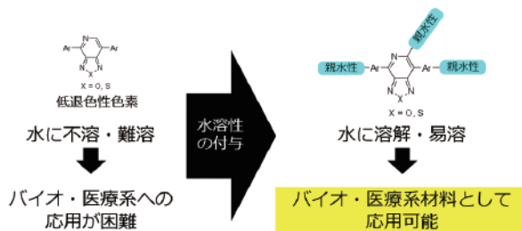
図2. 親水性有機蛍光材料の開発