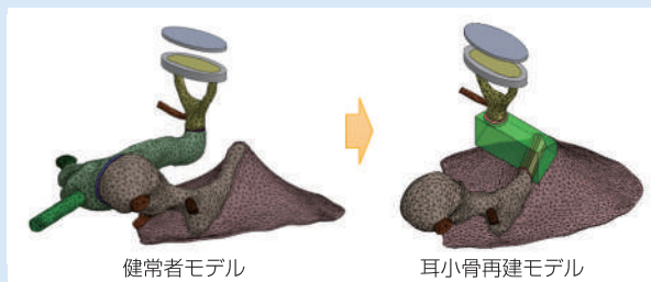
Fig. 2 耳小骨再建手術に用いられる人工代替物の最適設計