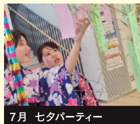
7月 セタパーティー