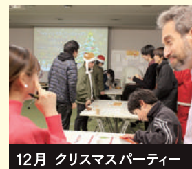
12月 クリスマスパティー