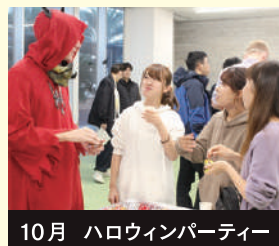
10月 ハロウィンパーティー