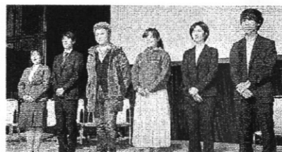
ユニークな事業計画を動画にして発表した学生たち