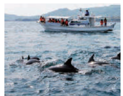
天草 生息する天草市五和町の沖合は、1年中高確率でイルカに合えるスポット。クルーズ船でウォッチングを楽しんで。