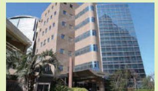
15_中山義崇記念図書館