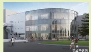
39_新棟(平成29年度完成予定)