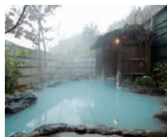
黒川温泉 阿蘇外輪山の裾野にある、隠れ里のような情緒溢れる温泉街。「温泉手形」で各旅館の温泉巡りも楽しめます。