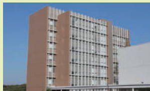
1_ナノサイエンス学科棟