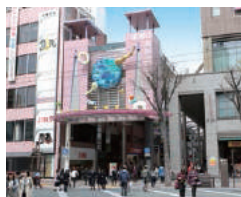
上通りアーケード 中心街に広がる全長360mの通り。パリの美術館のような空間に、カフェや本屋、楽器店など約170店が並びます。