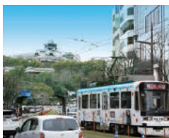
熊本城 加藤清正が築城した日本三大名城の一つ。現在城内には入れませんが、地震に負けず街を見守るように建つ姿は圧巻。