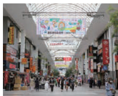
下通りアーケード ファッションやアミューズメントの中心地で、グルメ街としても有名な県内最大のアーケード。路上ライブ、イベントも開催されています。