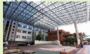
13_中庭(いこいの広場)