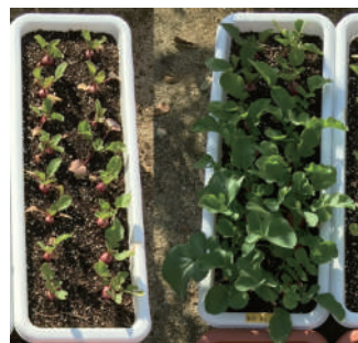
無投与群 光合成細菌投与群